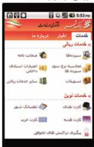
خروجی موبایل وب سایت